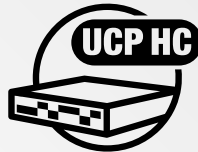
HYPERCONVERGED Unified Compute Platform HC