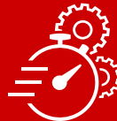
ANÁLISIS DE SOFTWARE