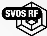
Unified Compute Platform CI