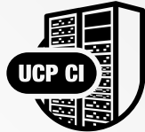
CONVERGED Unified Compute Platform CI