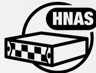
Unified Compute Platform HC